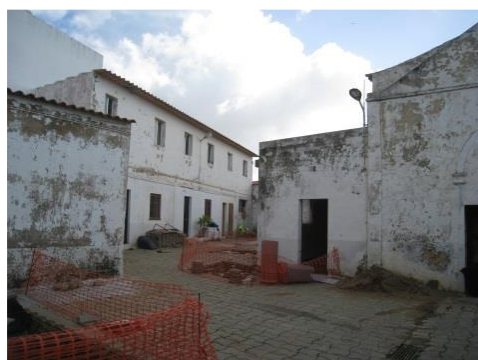
Antes da intervenção

A operação centra-se na conservação, restauro e valorização dos vestígios edificados da Igreja de Santa Maria, que correspondem à antiga Capela-Mor, tendo em vista a sua adaptação para espaço expositivo e de atividades culturais, e na criação de um novo espaço privado de uso público da cidade, um pátio murado que corresponde em dimensão às antigas naves da Igreja.