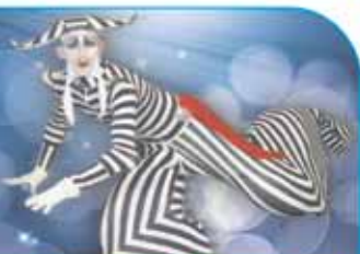
Summer Parade - Allgarve

| 6 a 14 Paginários '11 Auditório Municipal/Salão Nobre | Vários horários consultar programa