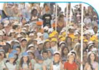
Dia Mundial da Criança

| 1 Dia Mundial da Criança Parque Lúdico | 09h30