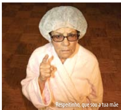
Respeitinho, que sou a tua mãe