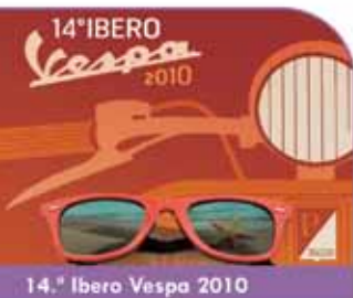
14.ª Ibero Vespa 2010