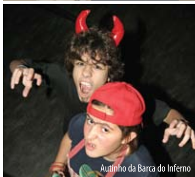
Autinho da Barca do Inferno