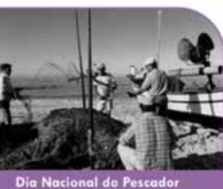
Dia Nacional do Pescador

Festival da Miudagem Parque da Alfarrobeira Sábado e Domingo | 10h00 - 20h00 Segunda e Terça | 10h00 - 19h00