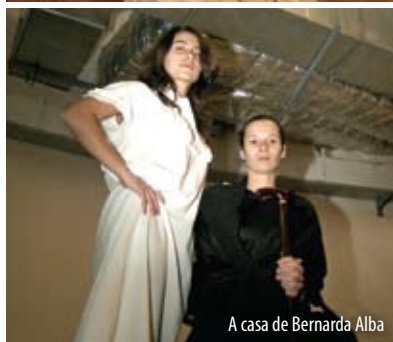
A casa de Bernarda Alba