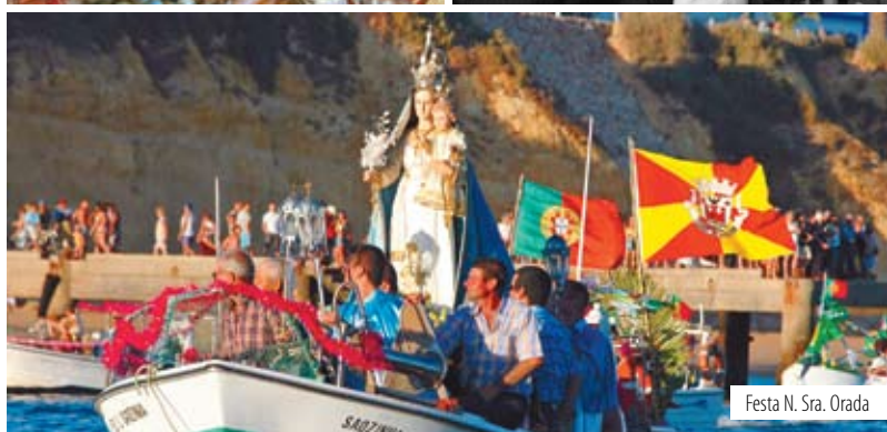
Festa N. Sra. Orada