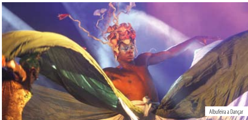
Albufeira a Dançar