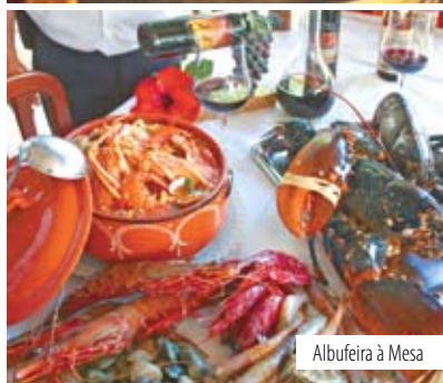
Albufeira à Mesa