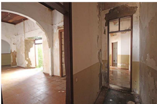
Antes da intervenção

Com a operação o Município de Albufeira pretende dotar o Edifício do antigo Tribunal de Albufeira das adequadas características físicas e funcionais para a instalação de um Centro de Artes e Ofícios, um equipamento público destinado primordialmente a atividades de divulgação de artes, técnicas, saberes e produtos artesanais locais, integrando a componente informativa, expositiva, formativa e comercial.