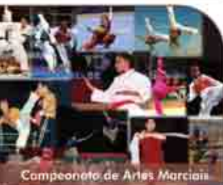
Campeonato de Artes Marciais

3º Campeonato de Artes Marciais Pavilhão Desportivo de Olhos de Água | 9h30 às 17h00