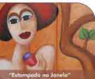
"Estampado na Janela"

Festa de São Martinho Junta de Freguesia de Ferreiras | 15h00 Junta de Freguesia da Gula - Parque de estacionamento junto ao polidesportivo | 16h00