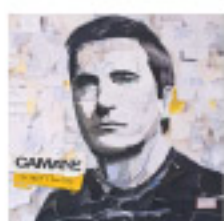
Camané Do amor e dos dias