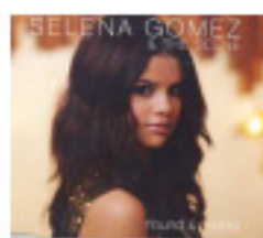
Selena Gomez & the Scene Round & round