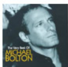
Michael Bolton The very best of