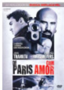
De Paris com amor