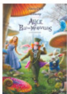
Alice no País das Maravilhas